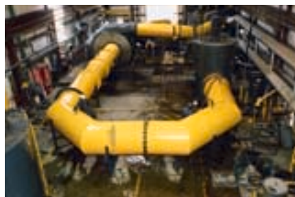
Гидравлическая лаборатория компании GIW

Являясь основной частью любой горнодобывающей инфраструктуры, насосы KSB обеспечивают эффективность эксплуатационных затрат и продолжительный срок службы. Наши решения всегда сфокусированы на клиенте. Мы проектируем насосы с учетом удобной доставки продуктов на каждом этапе процесса обогащения - решение, доказанное временем. Из сердца шахты к конечному продукту, KSB приближает будущее высококачественного обогащения и безопасной добычи.